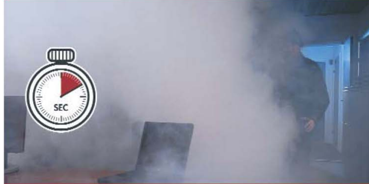
Después de sólo 10 segundos es difícil orientarse.