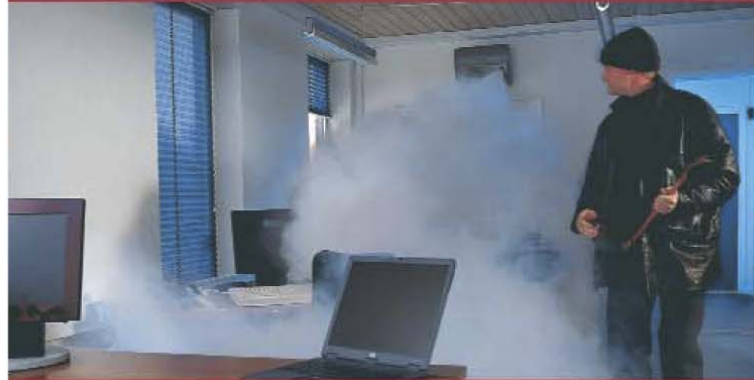
El ladrón entra, la alarma es activada y la protección de niebla se activa.