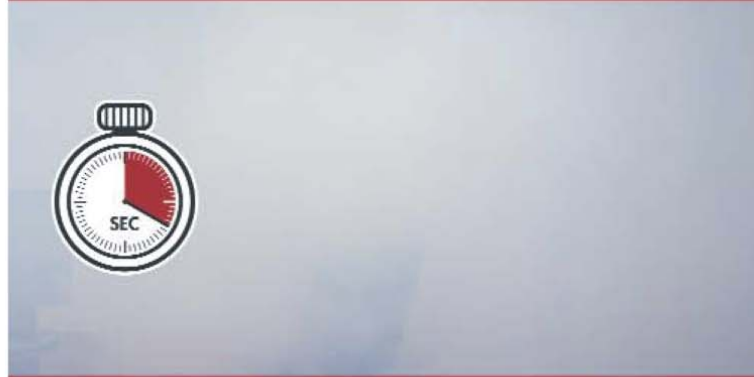
Después de sólo 20 segundos es imposible ver y robar nada.